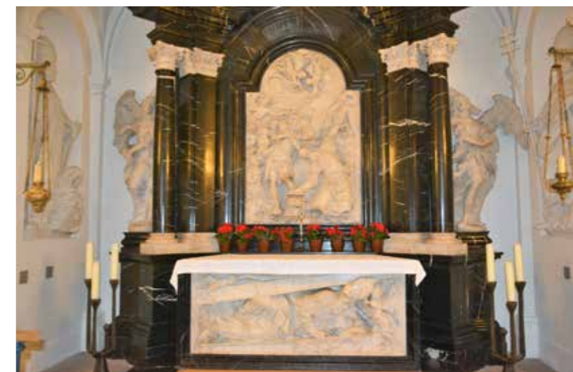
Sarkophag von Bonifatius im Dom in Fulda

Eine weitere wichtige Reliquie ist der Heilige Rock in Trier. Die Reliquie ist im Trierer Dom aufbewahrt und soll die Tunika Jesu Christi zeigen. Ob das Gewand Christi echt ist, kann man heute nicht mehr nachweisen. Die Legende sagt, dass die heilige Helena, die Mutter Konstantin des Großen, die Tunika Christi in Jerusalem gefunden und der Trierer Kirche geschenkt hat. Weitere bedeutende Reliquien sind die Sandalen von Jesus. Pippin III hat die Sandalen Jesu von Papst Stephan II bekommen. Er hat im Jahr 754 die Sandalen der Abtei St. Salvator in Prüm geschenkt. Im Dom in Aachen befinden sich wiederum folgende Reliquien: Windeln Jesu, das Lendentuch Jesu und das Kleid Mariens. Im Dom zu Fulda ist Bonifatius begraben, auch als „Apostel der Deutschen“ bekannt. Er ist eine der wichtigsten Figuren in der Geschichte des Christentums in Deutschland. An seinem Grab in Fulda versammelt sich alljährlich die Deutsche Bischofskonferenz. In vielen Kirchen in der Welt finden sich Holzpartikel des Kreuzes, an dem Jesus verstorben ist. Was sagen wir als Christen zum Grabtuch von Turin? Wie wir sehen, gibt es viele Reliquien in unseren Kirchen. Die Gläubigen erhoffen sich Hilfe und Heilung, wenn sie in einen Kontakt mit einer Reliquie kommen oder auch Unterstützung im Gebet. Für viele Gläubigen sind Reliquien sehr bedeutsam.