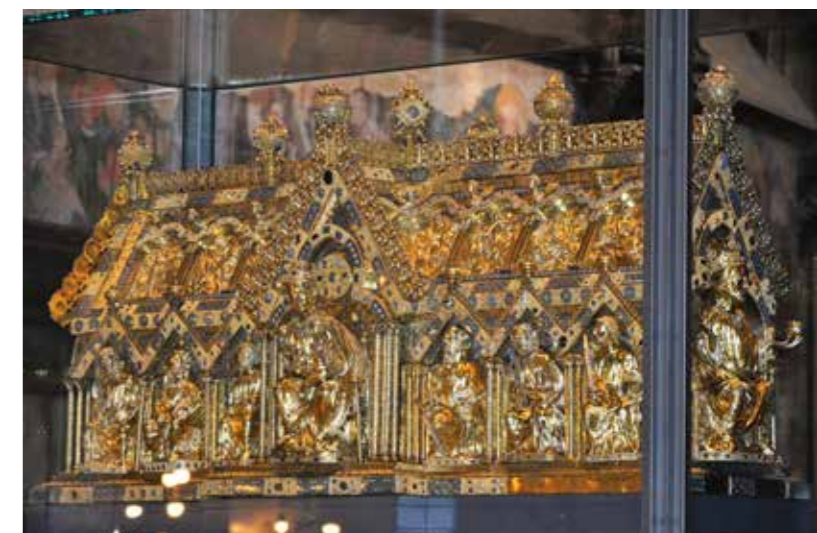
Marienschrein im Aachener Dom