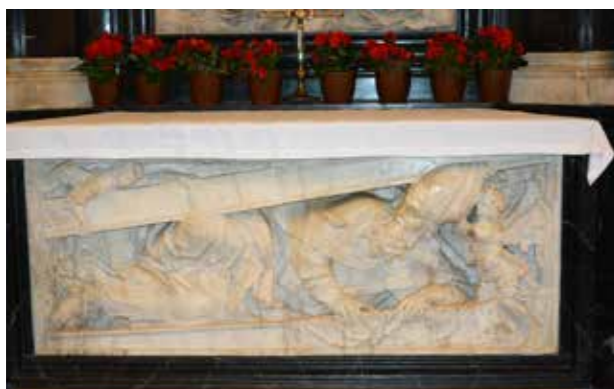
Sarkophag von Bonifatius im Dom in Fulda

Eine Reliquie (lat. Reliquiae: Zurückgelassenes, Überbleibsel, Rest) ist ein irdischer Überrest des Körpers eines Heiligen oder ein Überbleibsel seines persönlichen Besitzes.