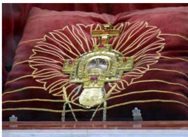
Die Heilig-Blut-Reliquie von Weingarten

Jesus und Maria wurden leibhaftig in den Himmel aufgenommen. Trotzdem finden wir hier in Deutschland Reliquien, die direkte Verbindung mit Jesus oder Maria haben. In Weingarten in der Klosterkirche finden wir seit 950 Jahren einige Blutropfen von Jesus mit Erde vermischt. Die Reliquien sind im Altar ausgestellt. Am Blutfreitag trägt ein Priester auf dem Pferd das Reliquiar durch Weingarten und das Umland, gefolgt von über zwei tausend Reiter in Frack und Zylinder. Der Blutritt wird jährlich von mehr als 30.000 Pilgern verfolgt.