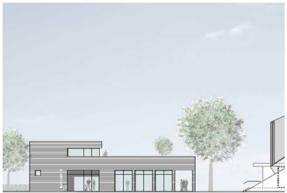
So könnte das neue Gemeindezentrum aussehen.