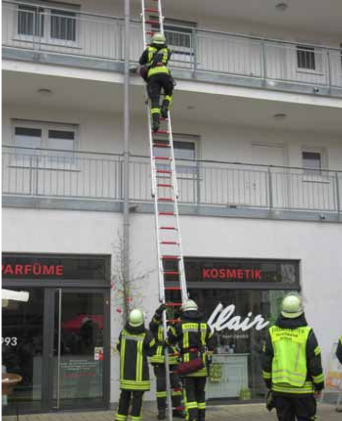
Die Süßener Feuerwehr bei ihrer Übung mit der Leiter ...

Die Feuerwehr hält regelmäßig Übungen für den Ernstfall ab. Das ist wichtig zur Überprüfung der Geräte und genauso wichtig ist, dass die Feuerwehr-Leute wissen, wo ihr Platz im Ernstfall ist.