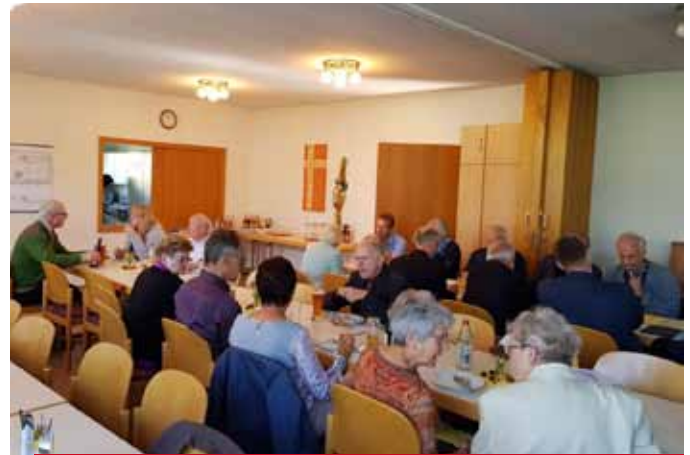
Während des Weißwurstessens wurde schon anregend über die Pläne diskutiert.