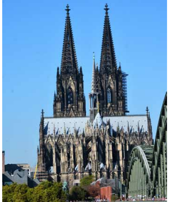
Die Außenansicht des Kölner Doms.

Die Geschichte des Domes begann noch im Römischen Reich. Im Jahre 313 wurde hier Bischof Maternus erwähnt. Am 27. September 870 wurde der alte Dom geweiht. In dieser Kirche befand sich das aus dem 10. Jahrhundert stammende Gerokreuz, das noch heute im Dom zu sehen ist. Im Jahre 1162 hat Kaiser Friedrich I Barbarossa die Stadt Mailand erobert. Später hat er seinem Reichskanzler, dem Kölner Erzbischof Rainald von Dassel, die in Mailand erbeuteten Reliquien der Heiligen Drei Könige geschenkt. Am 23. Juli 1164 brachte der Kölner Erzbischof die Reliquien von Mailand nach Köln. Das hat wiederum zu der großen Zahl der Pilger geführt. Der alte Dom war zu klein und man beschloss, einen neuen Dom zu bauen. Am 15. August 1248 hat der Erzbischof Konrad von Hochstaden den Grundstein