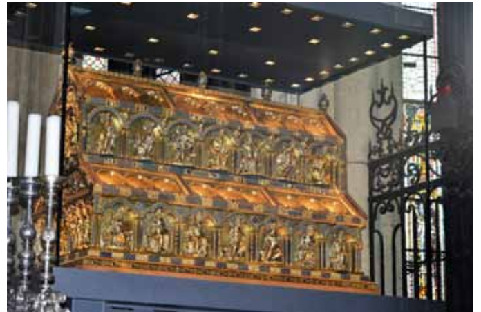
Der goldene Dreikönigsschrein des Kölner Doms.

10 000 qm. Das Chorgestühl ist mit 104 Sitzplätzen das größte Chorgestühl in Deutschland und hat sogar zwei extra Plätze für den Papst und den Kaiser. Im Jahr 1842 hat König Ludwig I von Bayern die fünf „Bayernfenster“ gestiftet. 1996 wurde der Kölner Dom von der UNESCO auf die Liste der Weltkulturerbe gesetzt. Im Jahr 2005 hat Papst Benedikt XVI den Dom besucht. Jedes Jahr kommen ca. 6 Millionen Besucher aus der ganzen Welt hierher.