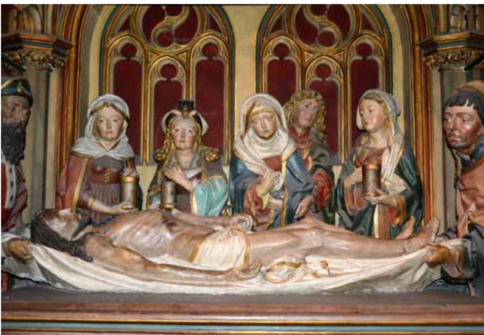
Die Grablegung Christi als 14. Station des Kreuzweges im Inneren des Kölner Doms.

zum Neubau gelegt. Gebaut wurde nach dem Plan vom Dombaumeister Gerhard von Rile, der gerade die Sainte Chapelle in Paris fertiggestellt hatte. Als Vorbild für den Kölner Dom diente die Kathedrale von Amiens. Am 27. September 1322 hat Erzbischof Heinrich von Virneburg den Chor geweiht. Im Jahre 1410 war der Südturm schon 56 m hoch und man konnte die erste Glocke aufhängen. Am Anfang des 16. Jahrhunderts sind nach der Reformation immer weniger Pilger nach Köln gekommen, was zu finanziellen Proble-