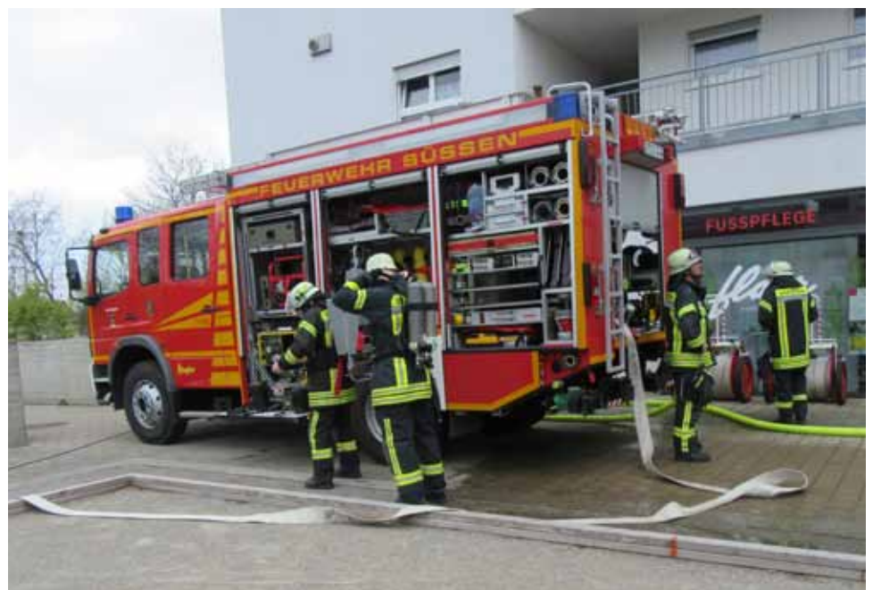
... und das Feuerwehrauto im Einsatz.

Keine Sekunde der uns geschenkten Lebenszeit ist wiederholbar. Schwere Momente in unserem Leben können wir nur im Vertrauen auf Gott meistern - mit IHM an unserer Seite. Wenn wir seine Hand nicht loslassen, dann werden wir auch schlimme Zeiten im Leben überstehen: ohne vorheriges „Üben des Ernstfalles“.